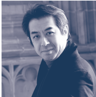
指揮 キンボー・イシイ

多摩と島しょ地域でオーケストラ公演やアンサンブル公演を開催。全て無料公演ですので、子供から大人までクラシック音楽をお気軽にお楽しみいただけます。